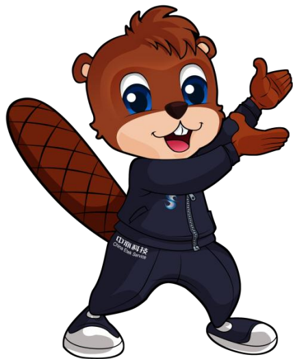
中亦科技吉祥物 海狸先生